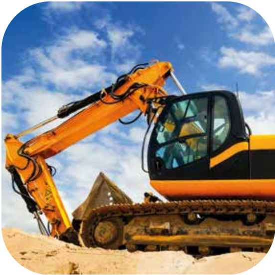
Mobilhydraulik / Mobile hydraulics