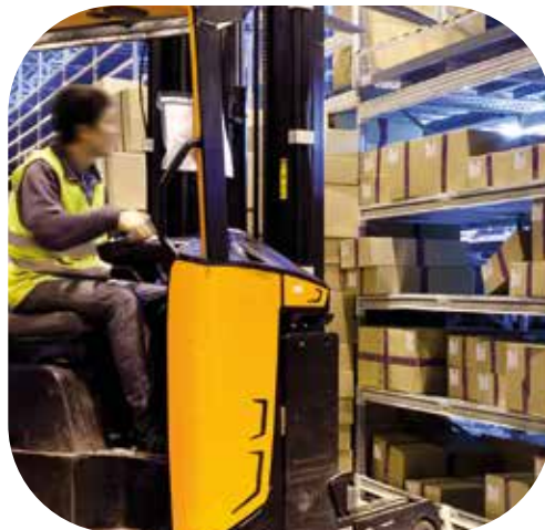
Flurförderzeuge / Material handling