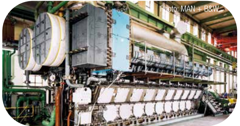
Großmotoren / Large engines