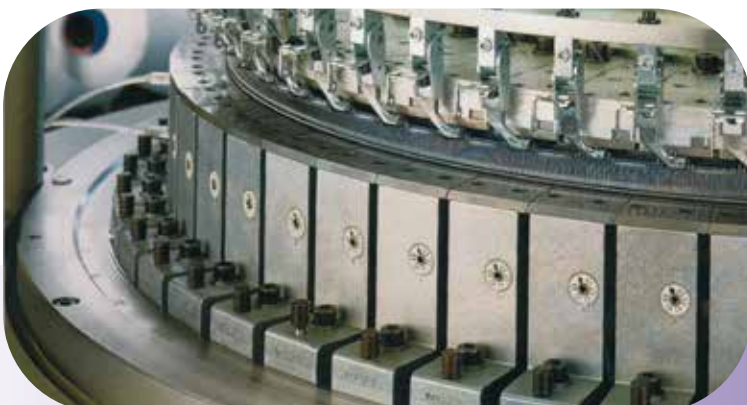
Wartung & Inbetriebnahme / Service & commissioning